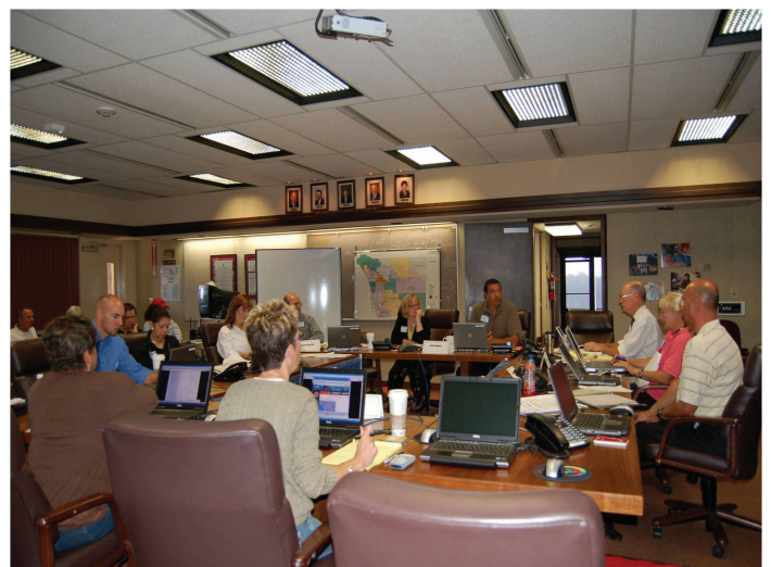
SDCOE Emergency Operations Center during wildfires.

La colaboración y la comunicación entre la SDCOE, los distritos escolares y las agencias de apoyo del condado son de interés principal para la planificación de futuras actividades de respuesta y recuperación en caso de que este tipo de catástrofe natural vuelva a ocurrir. La respuesta colectiva de los distritos escolares durante los incendios arrasadores y la colaboración durante el período subsiguiente al incidente son los resultados de todos estos esfuerzos, que forman parte de las lecciones aprendidas de esta experiencia.